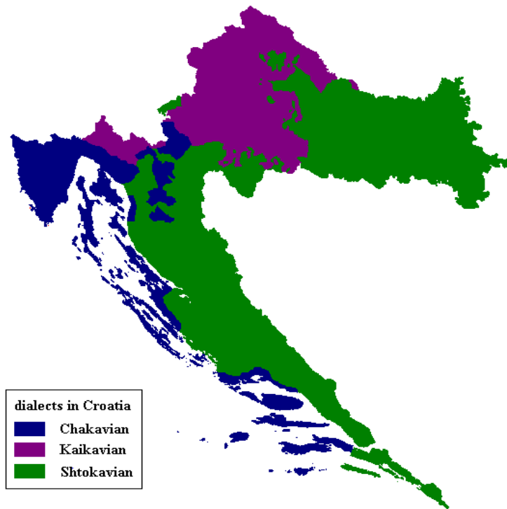
Karta 2. ( http://en.wikipedia.org/wiki/Kajkavian )