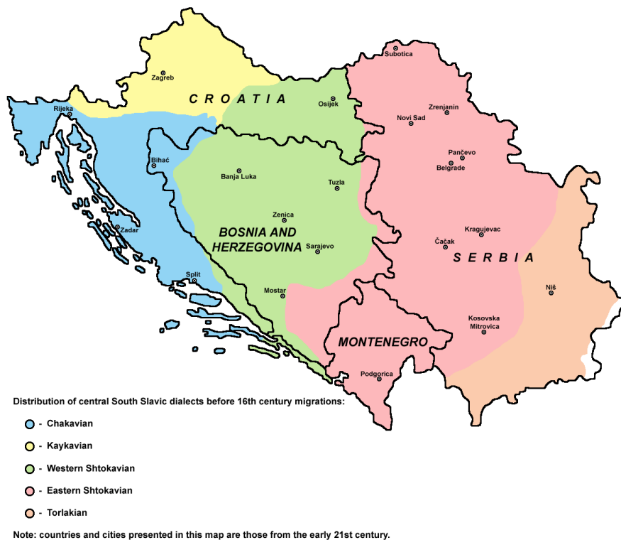
Karta 1. (Lisac, 2003: 164 – 165)

Srednjovjekovno je čakavsko područje bilo znatno veće od današnjega čakavskoga područja. Čakavsko se narječje u srednjem vijeku rasprostiralo od Istre do ušća rijeke Cetine; u unutrašnjosti do blizine rijeke Kupe te rijeke Save na sjeveru; na istoku je granica bila dolina rijeke Une te područje do Dinare i Omiša. Mljet i drugi otočići oko njega kao i istočni dio poluotoka Pelješca bili su zapadnoštokavski dok su ostali otoci i zapadni dio poluotoka Pelješca bili čakavski. Labava je bila granica između čakavštine i zapadnoštokavštine. Makarsko primorje kolebalo se između čakavskoga i zapadnoštokavskoga razvoja te je naposljetku prevladao štokavski razvoj. Na sjeveru je čakavština graničila s kajkavštinom "do blizine Kupe i glavninom do blizine Save na sjeveru" (Lisac, 1999: 9).